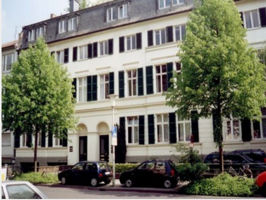
Institut für Politische Wissenschaft und Soziologie, Universität Bonn